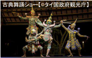
古典舞踊ショー【タイ国政府観光庁】 ※掲載写真はイメージとなります。ご旅行の参考にご覧ください。